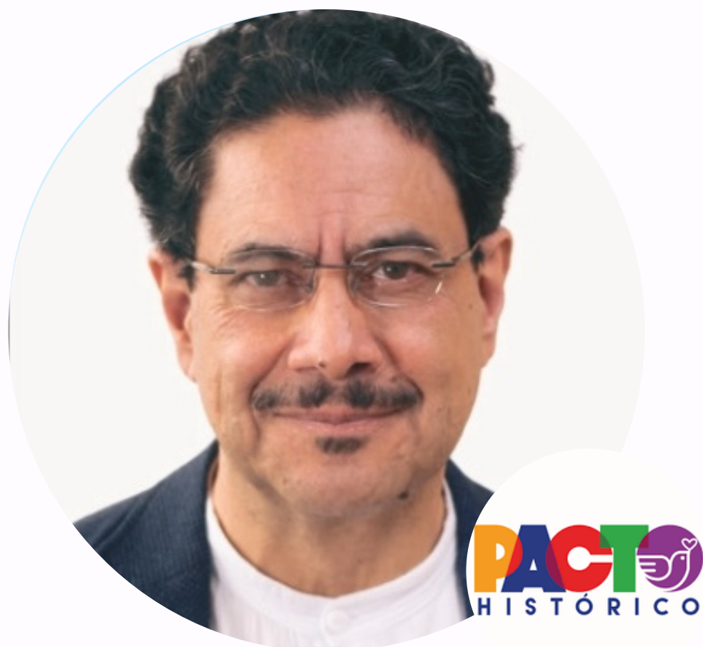
Iván Cepeda Pacto Histórico

Profesor de filosofía, defensor de Derechos Humanos y senador desde 2014. Facilitador del Acuerdo de paz entre el gobierno de Colombia y las FARC y de los diálogos con el Ejército de Liberación Nacional (ELN). Fundador del Pacto Histórico, ganó su candidatura en una interna partidaria con un respaldo de 2 millones de votos.